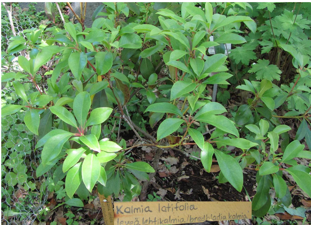
Kuva 4. leveälehtikalmia