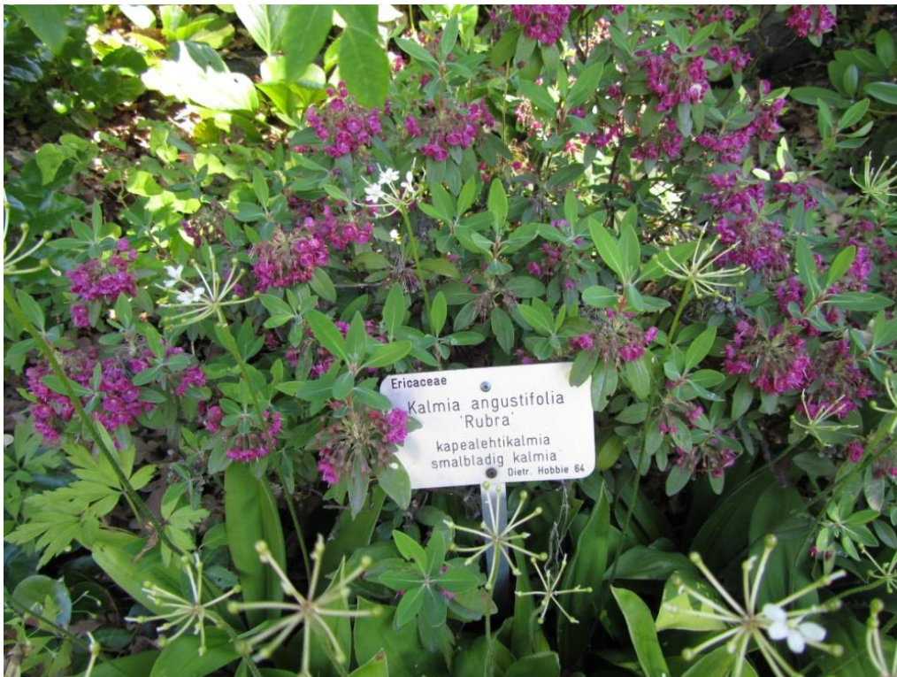
Kuva 3. Kapealehtikalmia

Puutarhasta löytyy muutama Kalmin mukaan nimensä saanut kasvi. Kapealehtikalmian ( Kalmia angustifolia ) lisäksi sieltä löytyy myös vuorilaakeri eli leveälehtikalmia ( Kalmia latifolia ). Lisäksi siellä kasvaa Kalminpensaskuisma (Kalm St. Johns wort , Hypericum kalmianum ).