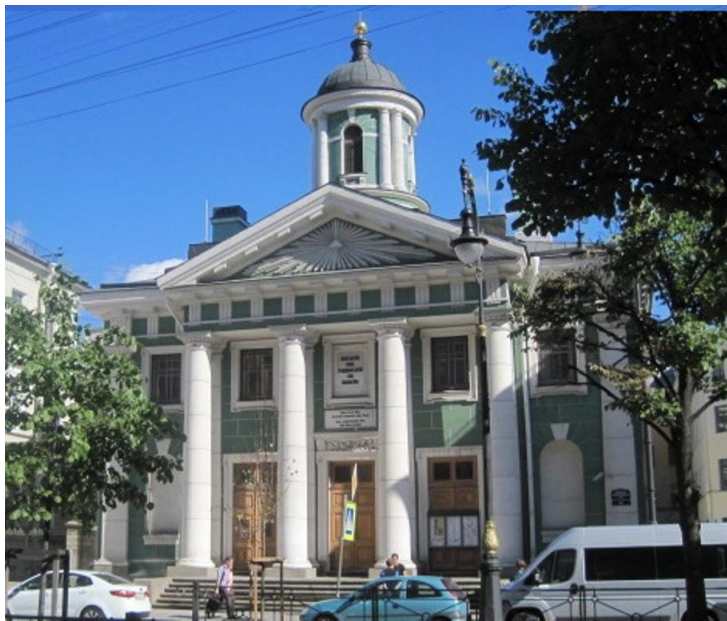
Pyhän Marian kirkko Pietarissa

Eremitaasissa oli aikaa vajaa kolme tuntia, jonka jälkeen voi jäädä kaupungille tai palata bussilla laivalle. Koska aikaa oli, niin Eremitaasista käveltiin pienellä porukalta Pyhän Marian kirkolle, jossa toimii Pietarin suomalainen seurakunta. Siellä oli silloin menossa venäjänkielinen jumalanpalvelus, mutta pääsimme silti katsomaan kirkon sisällekin.