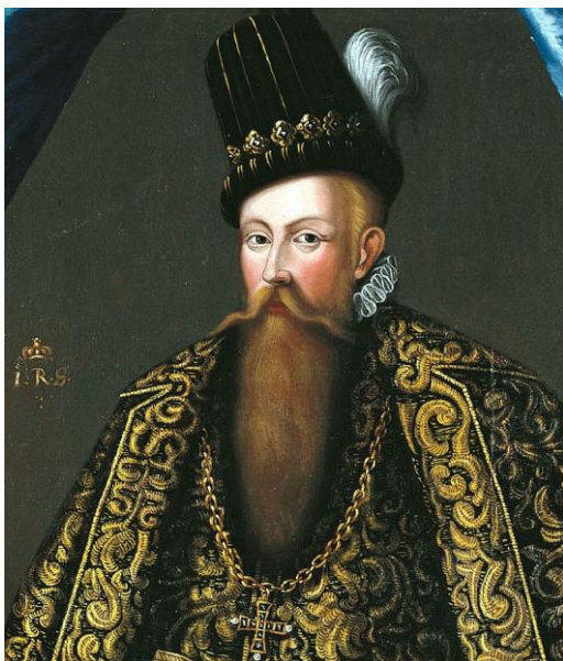
Juhana Herttua (Juhana III)

Juhana Herttua avioitui vuonna 1562 Puolan kuninkaan sisaren Katarina Jagellonica kanssa. Juhanan veli kuningas Eerik ei pitänyt moisesta tempusta, vaan piti sitä valtiopetoksena ja Juhana tuomittiin kuolemaan. Vuonna 1563 Eerikin armeija nousi maihin Turussa ja valloitti linnan ympäristön. Ja kuten voi arvata Korppoolaismäelle perustettiin tykkipatteri, joka alkoi pommittaa linnaa. Linnan muureissa on vieläkin jäljellä kohtia, joihin tykkien ammukset ovat tehneet kolojaan