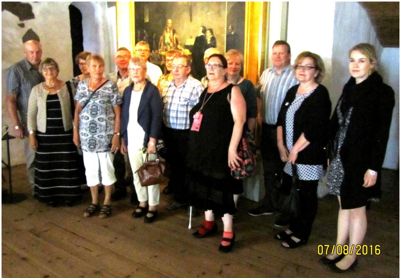
Sukukokouksen osanottajia Linnan aulassa. Taustalla näkyy maalaus "Kaarle-herttua herjaa Klaus Flemingin ruumista" Tekijä: Albert Edelfelt: Valmistumisvuosi: 1878:

Ruoan ja kokouksen jälkeen lähdettiin kiertämään linnan sisätiloja. Mukaan saatiin asiantunteva opas, jonka johdolla kierrettiin kahden kerroksen tilat.